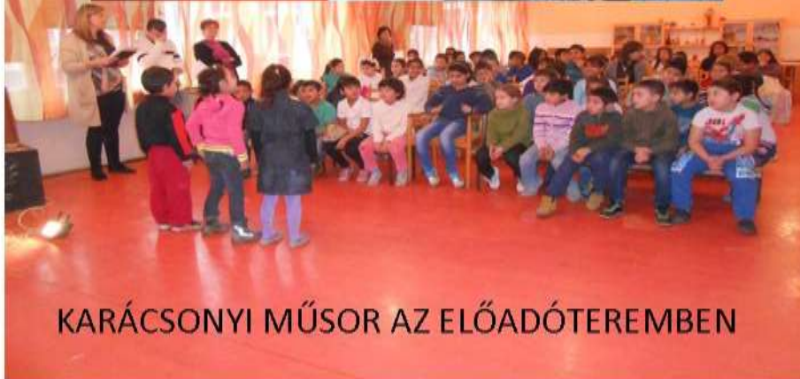
KARÁCSONYI MŰSOR AZ ELŐADÓTEREMBEN